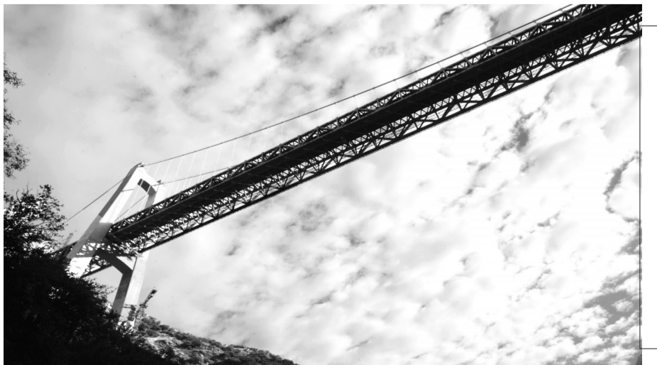
丽香铁路金沙江特大桥是丽香铁路建设的重点控制性工程,大桥全长882.5米,主跨跨径660米,1号主塔高194.5米,2号主塔高155.5米,是国内首座大跨度钢桁梁铁路悬索桥,桥面离江面垂直距离约250米,大桥两端与隧道连接。大桥于2015年10月1日开工,中铁大桥局经过五年多的建设,克服了安全风险高、施工场地狭小、高原雨季施工、线性控制难等问题,解决了我国山区铁路悬索桥建设的难题。大桥于2020年10月13日顺利合龙,目前已进入桥面系施工和主塔、主缆涂装的工作阶段。